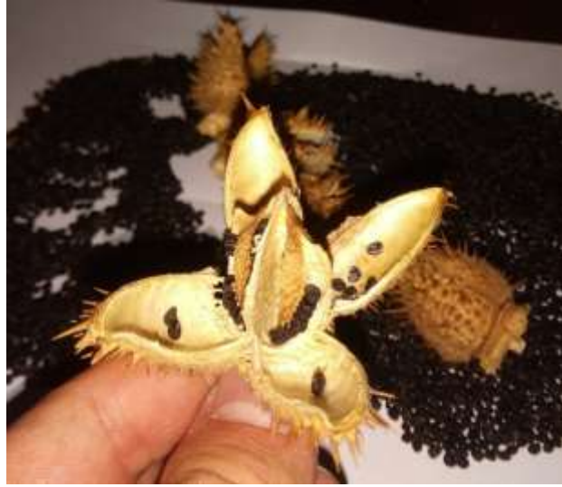
Şekil 1. D. stramonium 'un dikenli-kapsül şeklinde çok tohumlu meyvesi

Çalışmamız da kullanılmak üzere D. stramonium bitkisi Muğla ili Menteşe ilçesinde doğal ortamında ve Haziran ayının 2. haftasında yani çiçeklenme dönemi içerisinde toplanmıştır. Toplanan bitki güneş görmeyen gölge ortamda kurutma kağıtları içine konulmuş, oda sıcaklığında (22–24°C), her gün kurutma kâğıtları değiştirilerek ve çürüyenler ayıklanarak kurutulmuştur (Şekil 1). Daha sonra tohumları ayıklanarak porselen havanda sıvı azot ile öğütülmüş ve toz haline getirilmiştir. Elde edilen toz, metanol içinde 24 saat oda sıcaklığında bekletilip süzgeç kâğıdından geçirilmiştir. Daha sonra süzöntü 50°C sıcaklıkta soxhlet ekstraktörü ile yoğunlaştırılarak methanol ekstraktı (DS m ) elde edilmiştir.